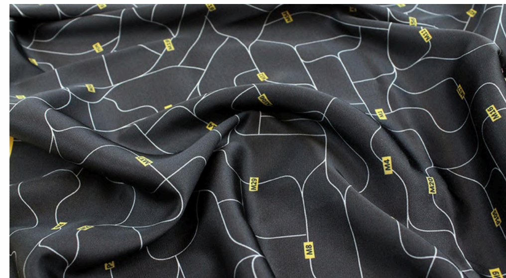
АРМАНИ 100 ГР./КВ.М.