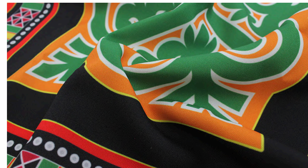
ГАБАРДИН 153 ГР./КВ.М.