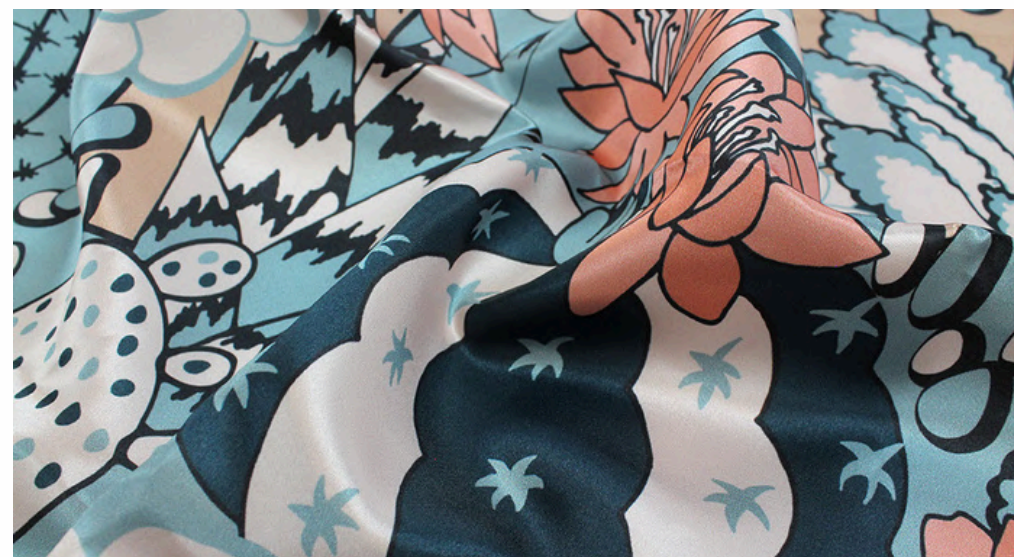
САТЕН 183 ГР./КВ.М.