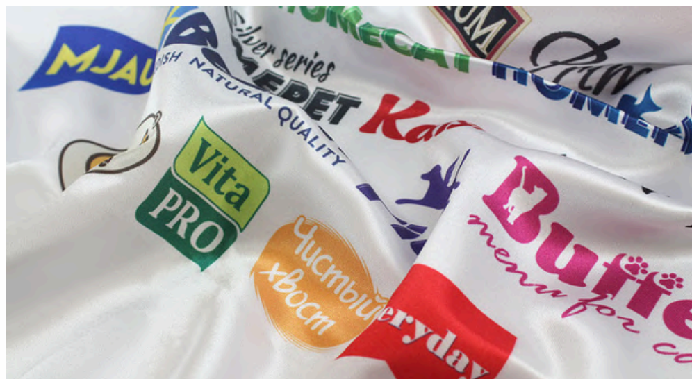
АТЛАС 140 ГР./КВ.М.