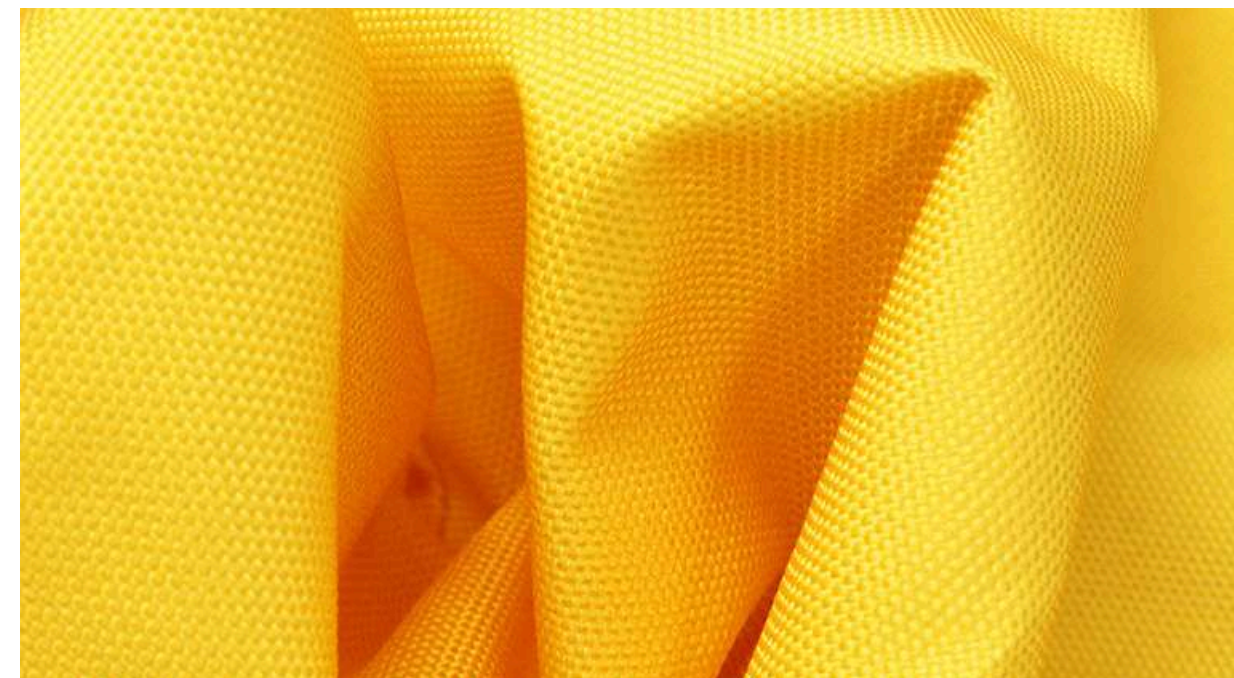
ТКАНЬ (ОКСФОРД 600ПУ 220 ГР./КВ.М.)

Материал хорошо выдерживает низкие температуры, устойчив к истиранию, механическим воздействиям и различным видам загрязнений.