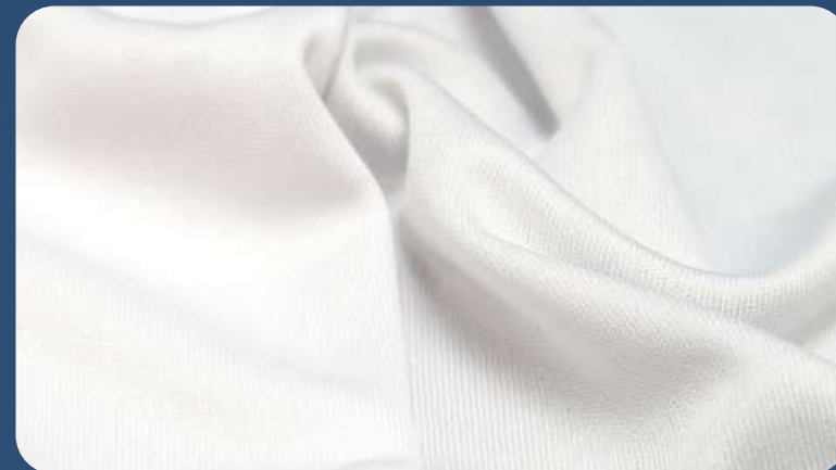
ПРИМА МИКРОФИБРА 135 Г./КВ.М