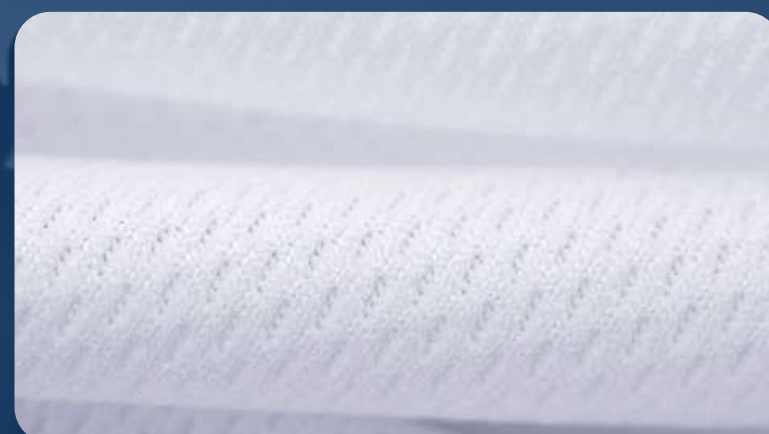
ЛОЖНАЯ СЕТКА 160 ГР./КВ.М.