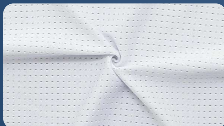
SQUARE GRID СПАНДЕКС 160 ГР./КВ.М.