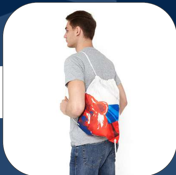
РЮКЗАКИ ДЛЯ ОБУВИ