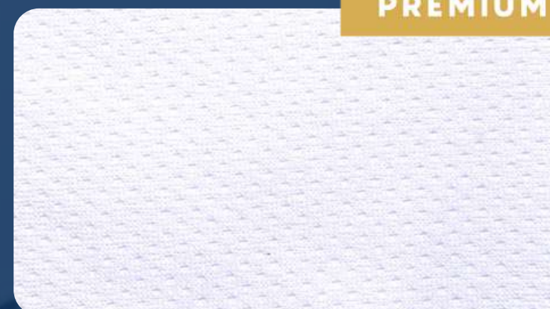
НИКА 135 ГР./КВ.М.