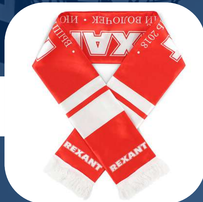
ШАРФЫ ДЛЯ ФАНАТОВ