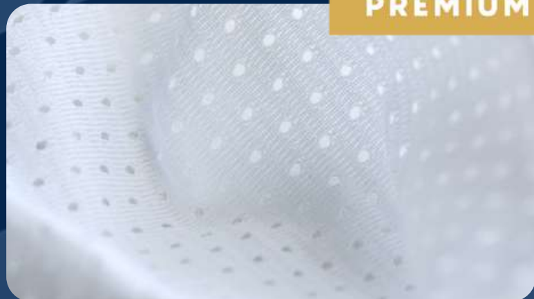
ХОККЕЙНАЯ СЕТКА 120 Г./КВ.М