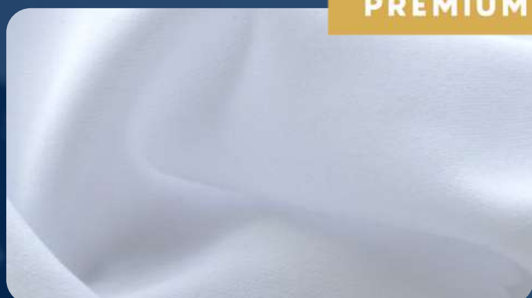
ПРИМА COOL & DRY 135 ГР./КВ.М.