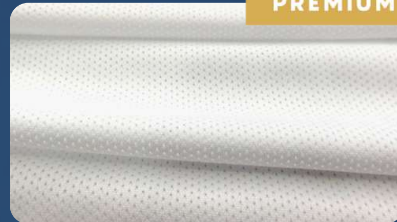
СЕТКА ОЛИМП 120 Г./КВ.М