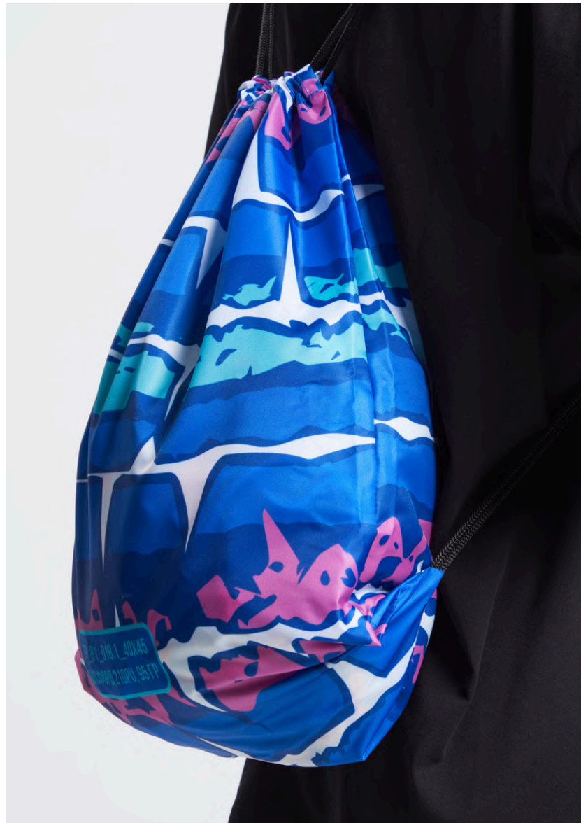
ОКСФОРД 210PU, 95 ГР./КВ.М.

Ткань с мелкозернистой фактурой. Достаточно плотная и прочная.