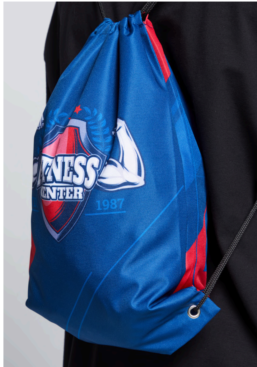
ОКСФОРД 600 PU, 220 ГР./КВ.М.

Ткань с мелкозернистой фактурой. Достаточно плотная и прочная.