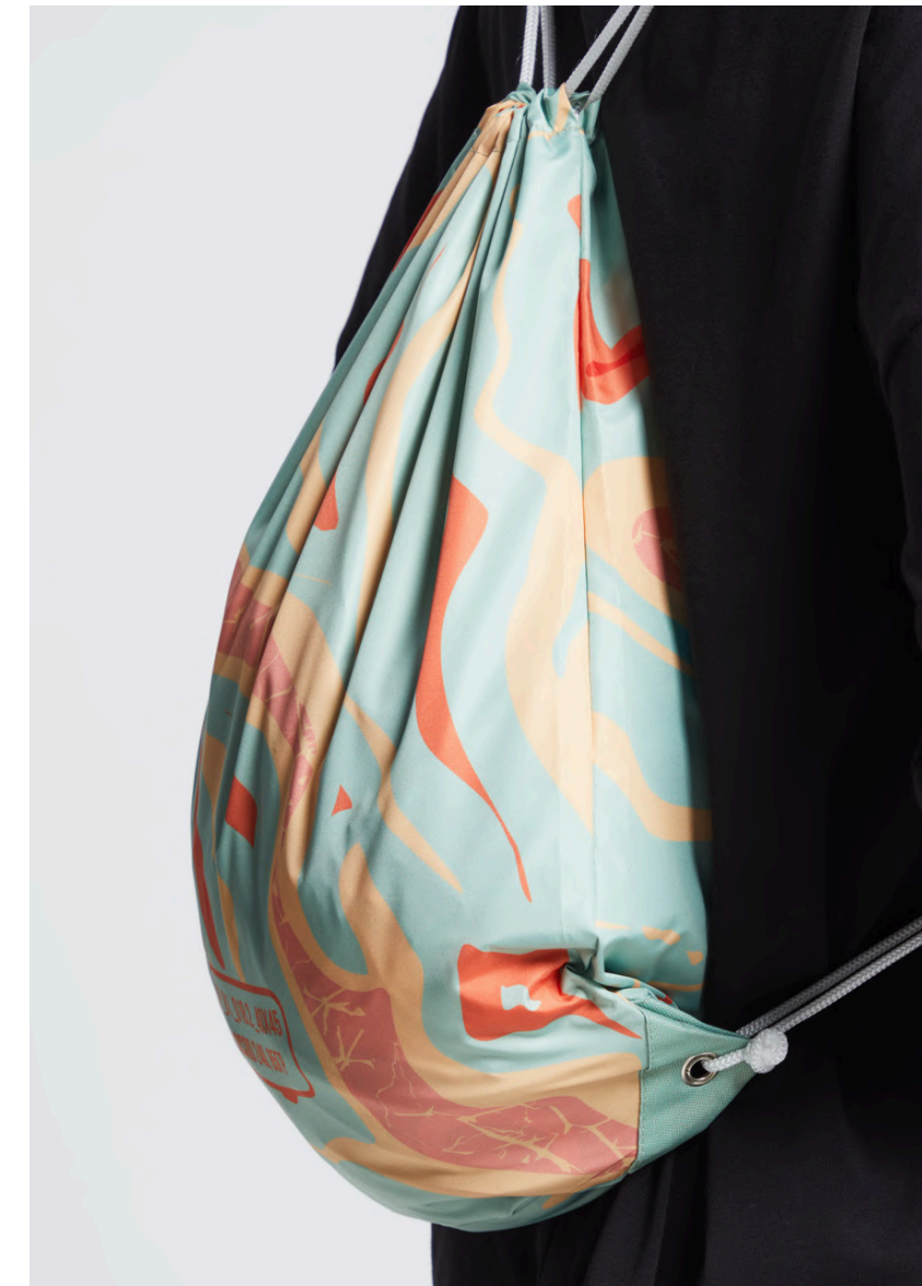
ДЮСПО 240 (85 ГР./КВ.М)

Материал с более высокой плотностью и прочностью. Плетение "рогожка".