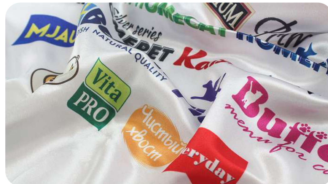
АТЛАС 140 ГР./КВ.М.