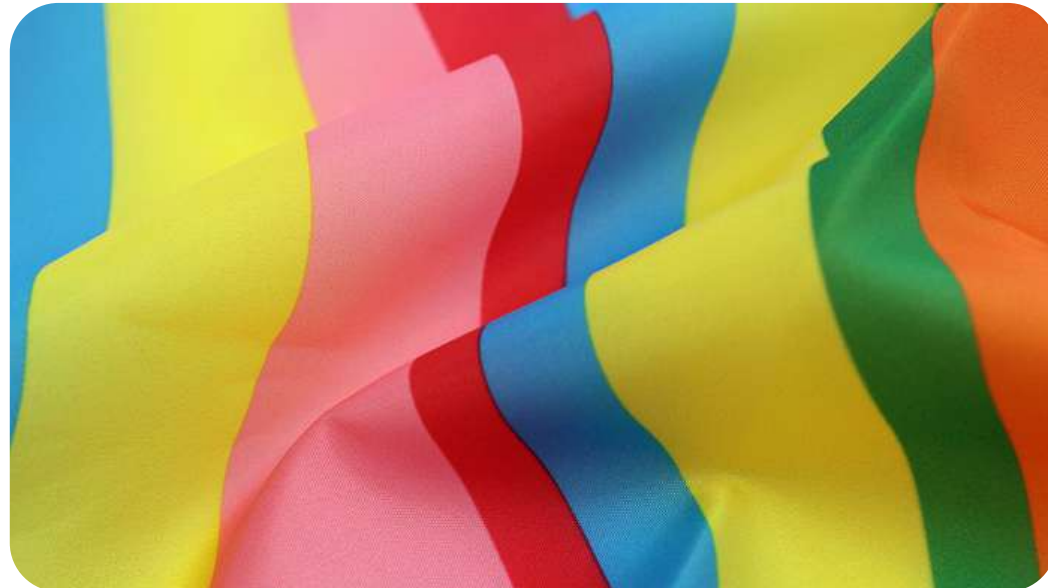
ПОЛИЭФИРНЫЙ ШЕЛК 55 ГР./КВ.М.