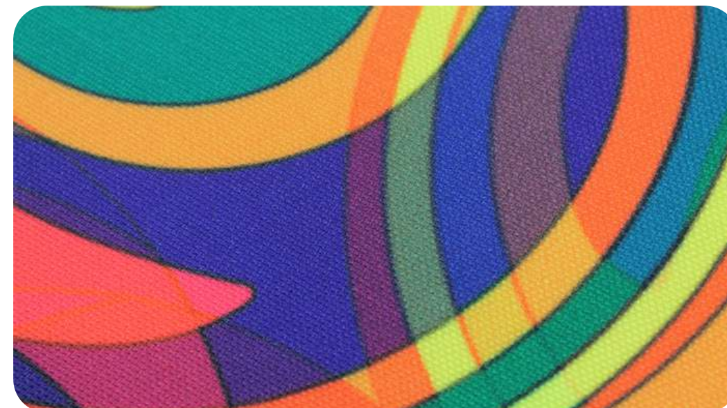
ПОЛИОКСФОРД 230 ГР./КВ.М.