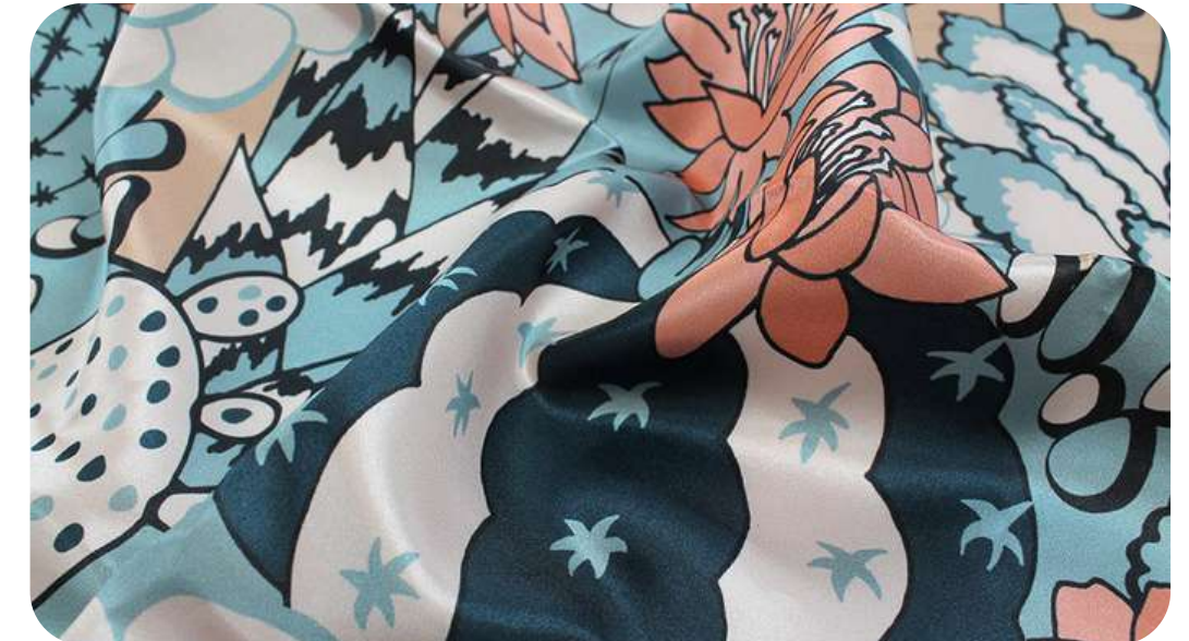
САТЕН 183 ГР./КВ.М.