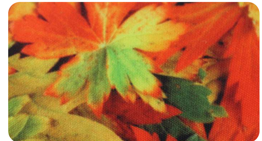
ОКСФОРД 210PU 95 ГР./КВ.М.