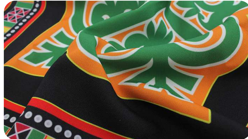
ГАБАРДИН 153 ГР./КВ.М.