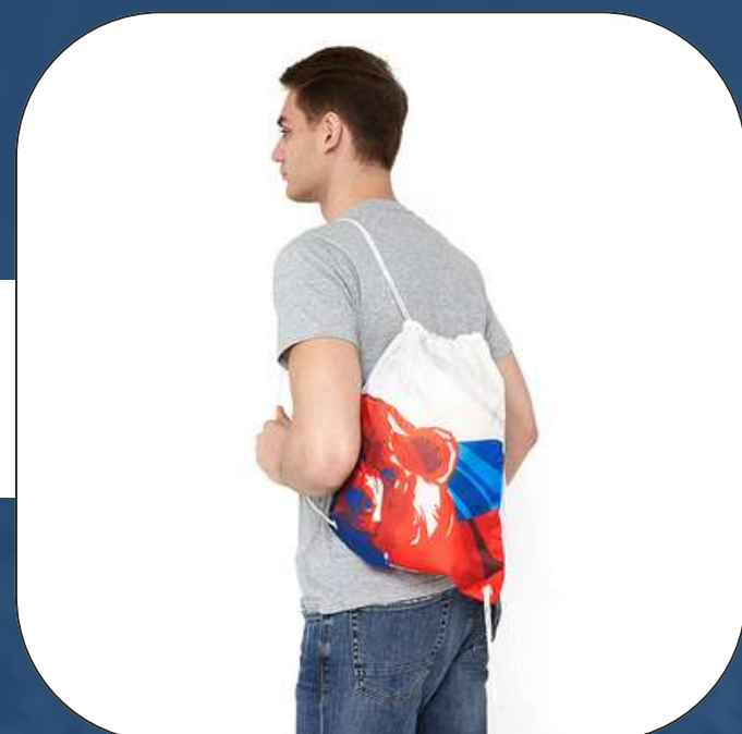
РЮКЗАКИ ДЛЯ ОБУВИ