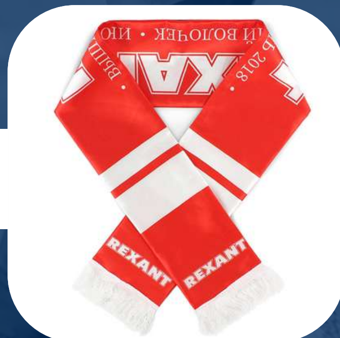
ШАРФЫ ДЛЯ ФАНАТОВ