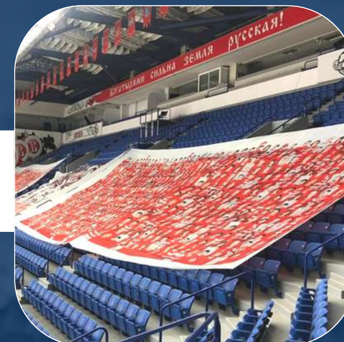
ПЕРЕТЯЖКИ НА СТАДИОН