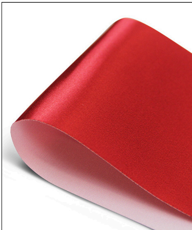
Атлас 140 гр./кв.м.