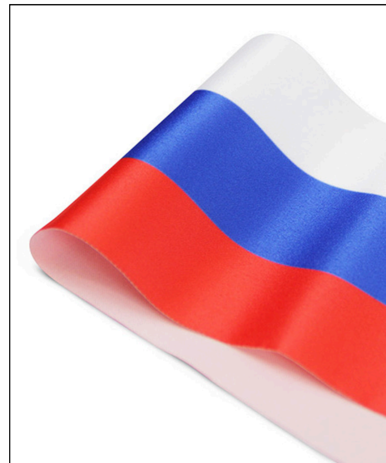
Сатен 183 гр./кв.м.