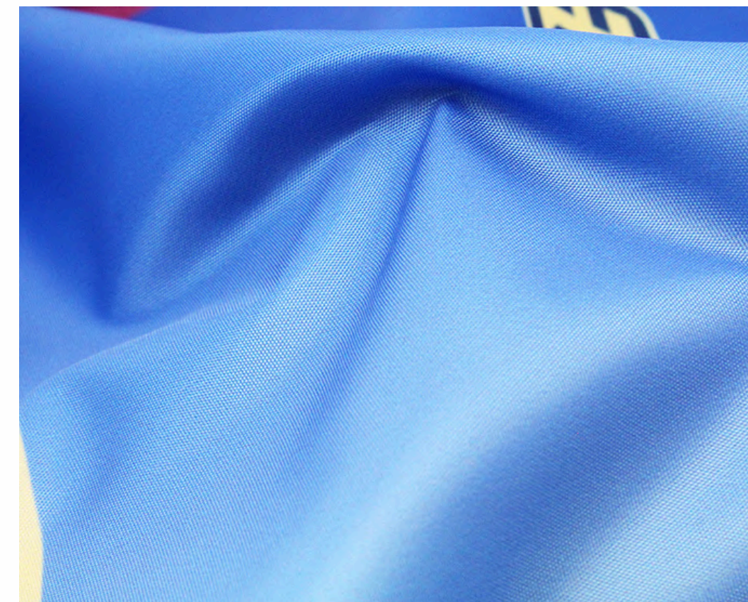
ОКСФОРД 210РУ, 95 ГР./КВ.М.

Материал прочный и плотный, не имеет блеска, не тянется и не деформируется.