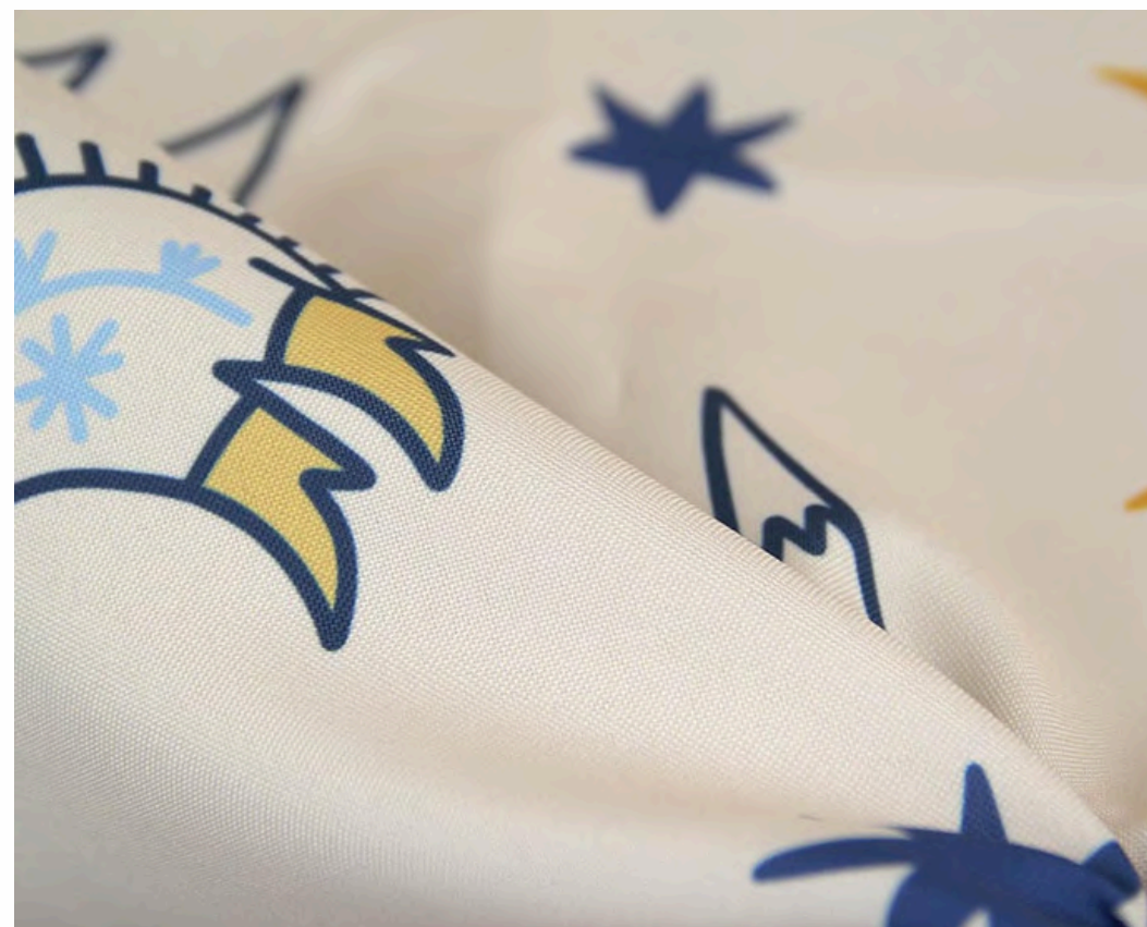
ГАБАРДИН 153 ГР./КВ.М.

Материал лёгкий, летучий, не тянется, практически не имеет блеска.