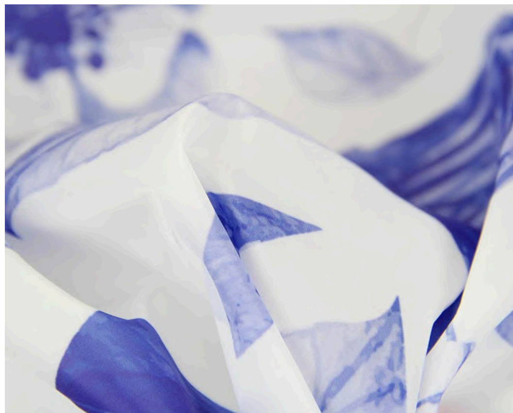
ПОЛИЭФИРНЫЙ ШЕЛК 55 ГР./КВ.М.

Материал используется для оформления краткосрочных мероприятий: выставок, акций, городских праздников.