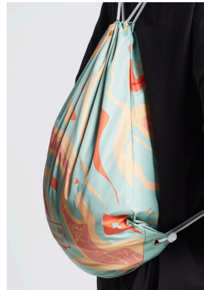
ДЮСПО 240 (85 ГР./КВ.М)

Материал с более высокой плотностью и прочностью. Плетение "рогожка".