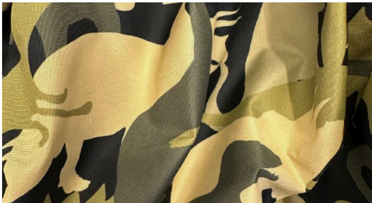
ДЮСПО 240, 85 ГР./КВ.М.

Прочная ткань с водоотталкивающими свойствами.