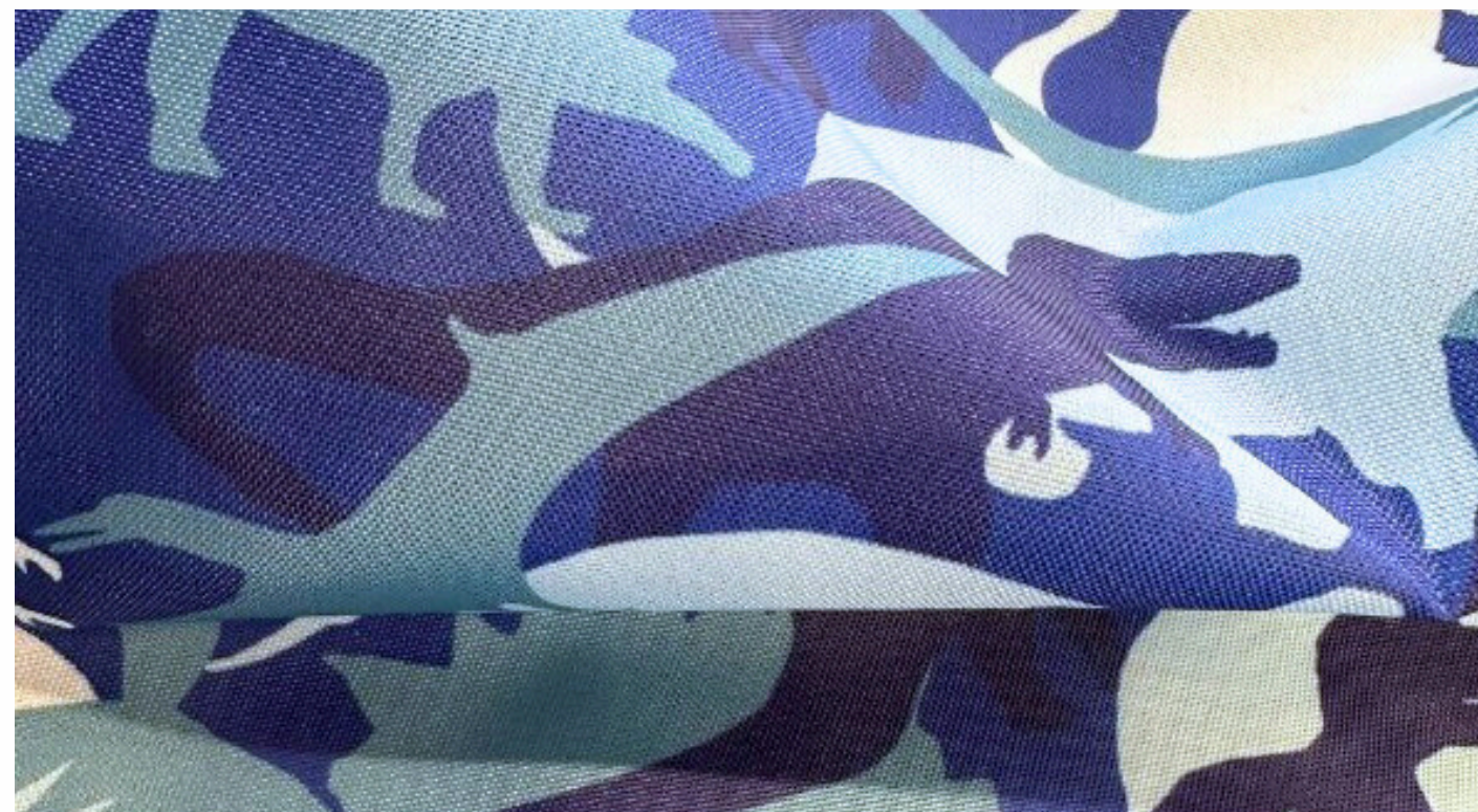
ОКСФОРД 210PU, 95 ГР./КВ.М.

Материал хорошо выдерживает низкие температуры, устойчив к истиранию, механическим воздействиям и различным видам загрязнений.