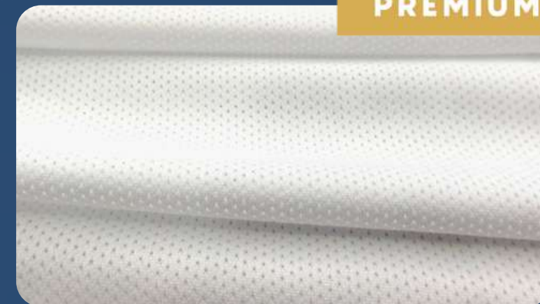
ОЛИМП 120 Г./КВ.М

ПОЛИЭФИРНОЕ ТРИКОТАЖНОЕ ПОЛОТНО СО СКВОЗНОЙ ЯЧЕИСТОЙ СТРУКТУРОЙ.