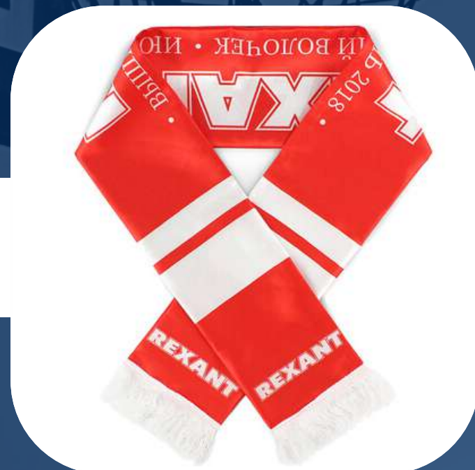
ШАРФЫ ДЛЯ ФАНАТОВ