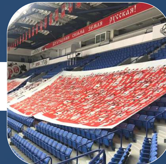
ПЕРЕТЯЖКИ НА СТАДИОН