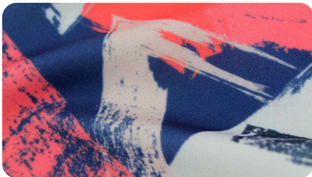
БИФЛЕКС 260 ГР./КВ.М.