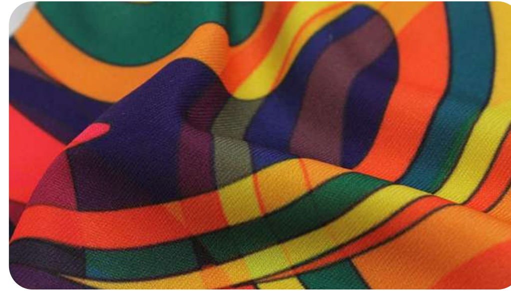
ПРИМА МИКРОФИБРА 135 ГР./КВ.М.(СТРЕЙЧ)