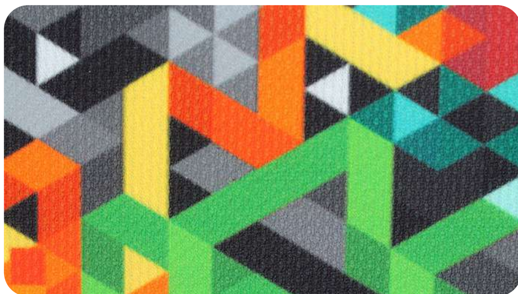
ЛОЖНАЯ СЕТКА 230 ГР./КВ.М.